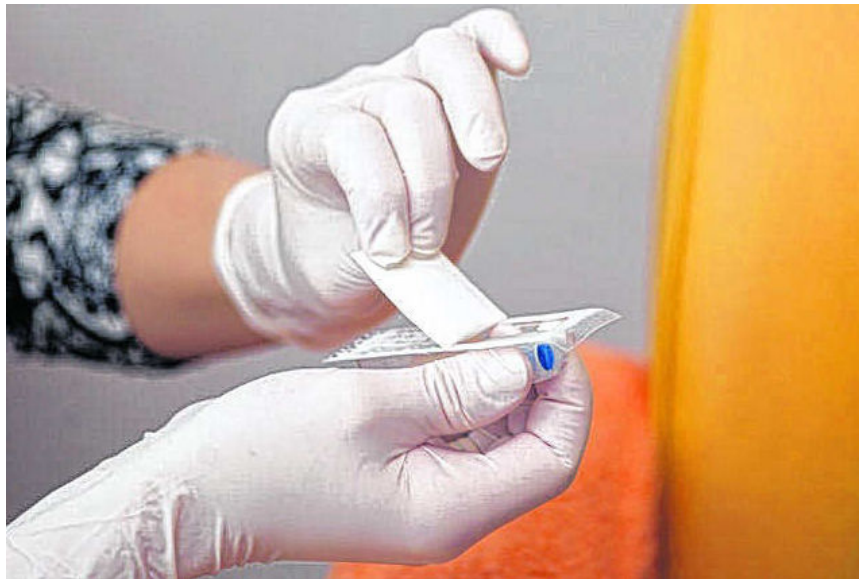
Anja Joos verwendet ausschließlich hochwertige Farben.